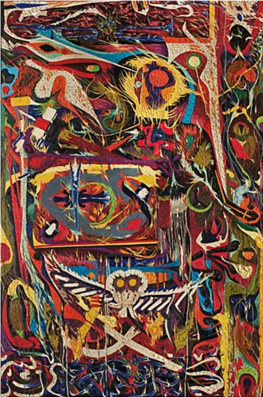
Alfonso Ossorio, Le Guerrier, la colombe et la chouette, 1954-1955

Ainsi, une première partie est dédiée aux débuts de Michel Tapié à la galerie René Drouin, à la fin des années 1940, et présente un très bel ensemble de pièces de Dubuffet, Fautrier, Wols ou encore Mathieu. Le visiteur est ensuite amené à découvrir une salle essentiellement consacrée à des artistes américains qui sont passés, au cours des années 1950, par Paris et ont rencontré Tapié. Parmi ceux-ci, on notera notamment Tobey, Francis, Kline, De Kooning et surtout des artistes plus rares sur les cimaises comme Ossorio, Marca-Relli ou encore Falkenstein.