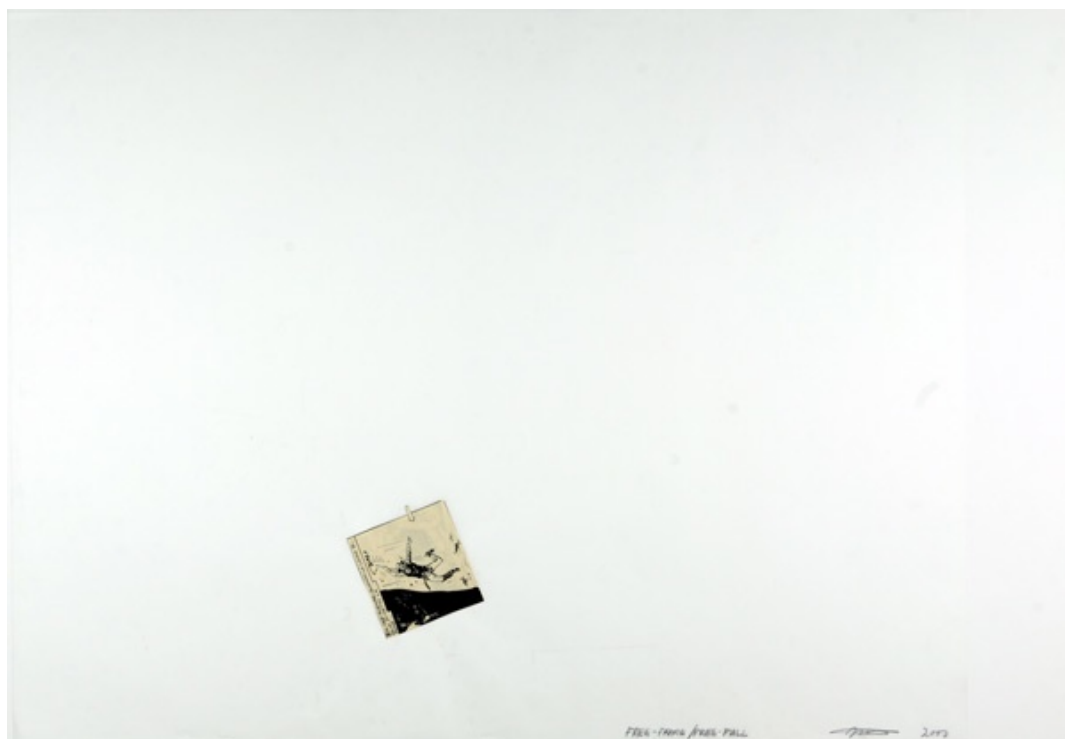
Miraculously, she hangs in the Sky , 2008, Collage sur papier, © de l'artiste et Layr Wuestenhagen, Vienne

Des exemples ? Dans sa série Skyline , l'artiste découpe des photos issues de l'International Herald Tribune ou du New York Times pour n'en conserver que le ciel. Avec la série Free Fall , à partir de bandes dessinées, il a isolé des images suffisamment fortes ou humoristiques pour se suffire à elles mêmes. Posées de biais ou de façon décentrées sur de larges cadres, le rendu est remarquable. Ces 2 séries ont en commun d'avoir une vraie force narrative. Elles racontent une histoire, ou, plus précisément, elles laissent au spectateur le soin de s'inventer sa propre histoire : elles sont une fenêtre ouverte à l'imagination. De là à dire que le travail de ce plasticien repose sur la spontanéité et l'expérimentation ? Oui lorsqu'il s'agit de dessins, de collages ou d'écriture. Non pour le reste de ses pièces qui procèdent au contraire d'une démarche très construite et réfléchie.