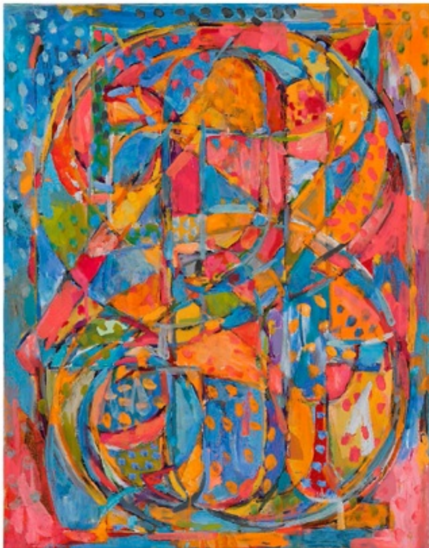
Jasper Johns, 0 through 9 , 1961 © Jasper Johns / Licensed by VAGA, New York

Même schéma chez Sotheby's qui met en vente – parmi les 55 lots de sa ventes du soir – deux icônes du Pop exécutées au tout début des années 1960. Coca-Cola [4] [ Large Coca-Cola ], une immense bouteille de Coca-Cola d'Andy Warhol réalisée entre 1961 et 1962 (lot n°12 - 20-25 m$). Ice Cream Soda , une toile de Roy Lichtenstein de 1962 (lot n°17 - 12-18 m$). Le top lot de la soirée est le lot n°21. Il s'agit d'un magnifique grand format de Rothko de 1955 dans les tons clairs (jaune, orange, blanc), estimé entre 20 et 30 millions de dollars.