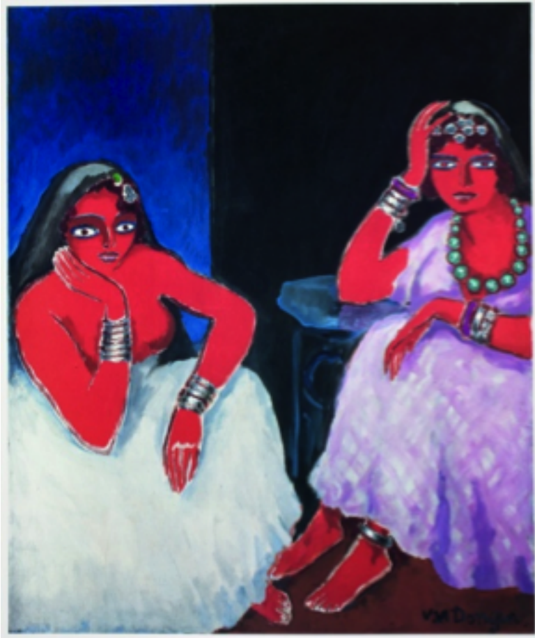
Marchandes d'herbes et d'amour

Matisse, Vlaminck, Derain. Des peintres qu'on dit fauves et qui privilégient les couleurs criardes qui manifestent la réalité immédiate de la perception. Ses tableaux adoptent désormais des tailles monumentales. Ses corps diaphanes des pauses d'un érotisme inouï, non sans annoncer le trait d'un Gruau. Ses visages et ses yeux écarquillés des dimensions secondaires. Le rouge saigne. Le bleu irradie. Le jaune incendie. Scandaleux ? Dérisoire.