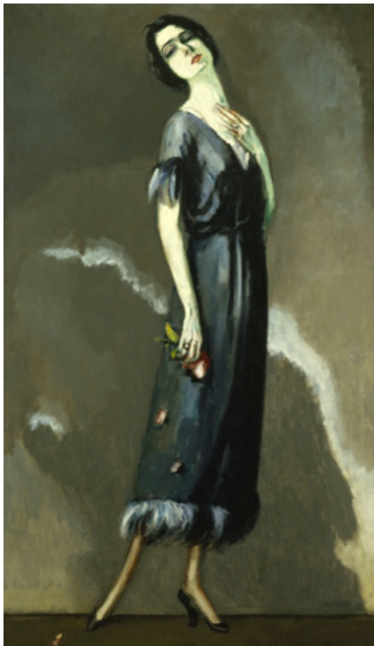
Maria Ricotti © ADAGP, Paris, 2011