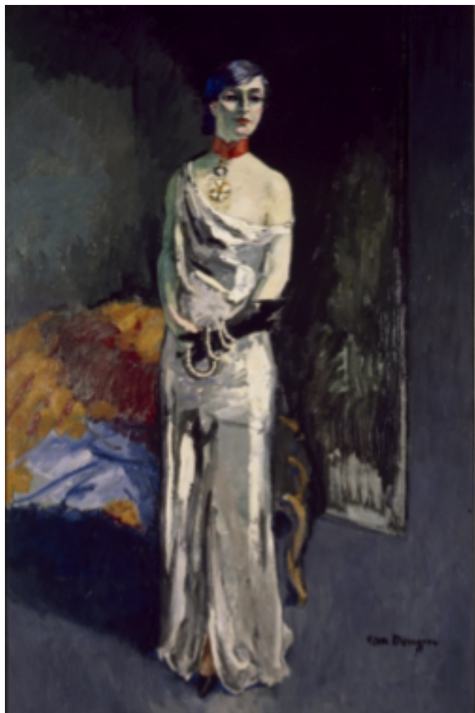
Anna de Noailles © ADAGP, Paris, 2011