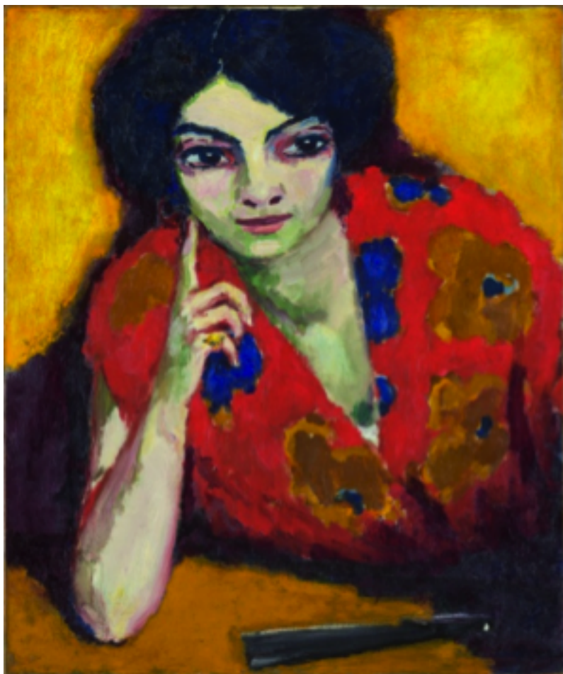
Le doigt sur la joue © ADAGP, Paris, 2011