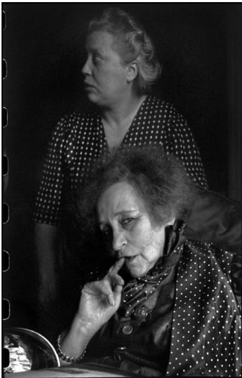
Henri Cartier-Bresson, Colette et sa dame de compagnie, 1952

Henri Cartier-Bresson: The Modern Century