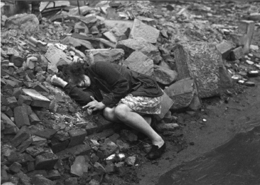
Henri Cartier-Bresson, Femme allemande pleurant sur un amas de ruine en 1945

HCB rejetait les étiquettes et particulièrement celle d'« humaniste » qui pourtant colle toujours à ses visions justes, décalées, plongées dans la condition humaine. Il refusait toute mise en scène pour la réalisation de ses clichés, prônant la simple reproduction de la réalité prise sur le vif et l'usage du noir et blanc.