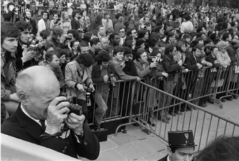
Henri Cartier-Bresson photographie le président français Georges Pompidou en 1974, à Paris

Selon le photographe Robert Frank, « Cartier-Bresson a voyagé dans des pays où il est impossible de photographier sans point de vue. En avait-il un ? Disons qu'il a bien aménagé son absence de point de vue ». Prenons l'exemple du cataclysme de la deuxième guerre mondiale. Prisonnier de guerre pendant deux années en tant qu'ancien sympathisant communiste, avant de s'évader au bout de la troisième tentative, HCB a fait des reportages sur les souffrances vécues par les allemands.