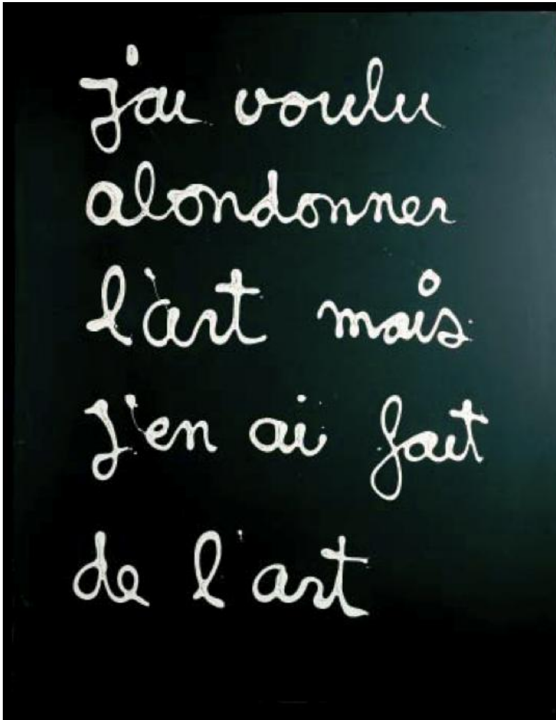
BEN, J'ai voulu abandonner l'art mais j'en ai fait de l'art , 1970 - © Adagp, Paris, 2009

L'exposition retrace ses cinquante ans de carrière et de questionnement. Nous avons accès à tous les détours de la recherche de Ben. De ses débuts à Nice à des créations inédites. Au fur et à mesure que l'on monte les trois étages, les a priori sur cet artiste très controversé tombent. Que l'on soit du milieu et pensions que Ben « c'était mieux avant » ou que l'on ne connaisse que les dérivés commerciaux de ses sentences écrites blanc sur noir, on y trouve des sources d'étonnement et de réflexions.