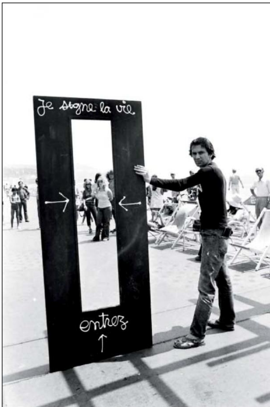
BEN, Je signe la vie , 1970 - © Adagp, Paris, 2009